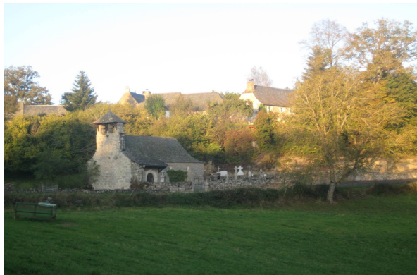
La chapelle de Mels